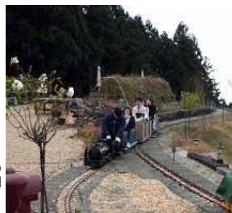
塩谷町上寺島 バリアフリー鉄道農園 「風だより」にて(11月17日)